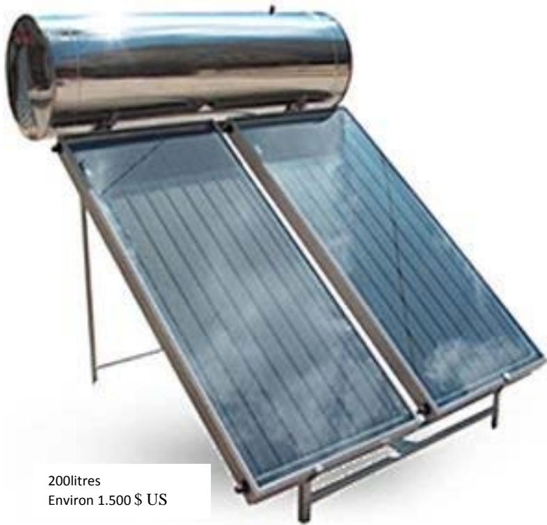
200litres Environ 1.500 $ US