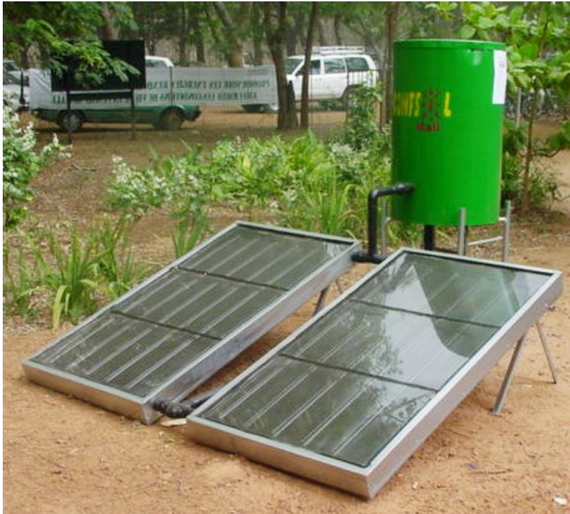
CHAUFFE-EAU SOLAIRE CONFSOL METALLIQUE (200litres) Caractéristiques Techniques

2.1 Réalisation dans le cadre du Recherche et Développement (R et D) : Le CNESOLER a mis au point et expérimenté les technologies suivantes :